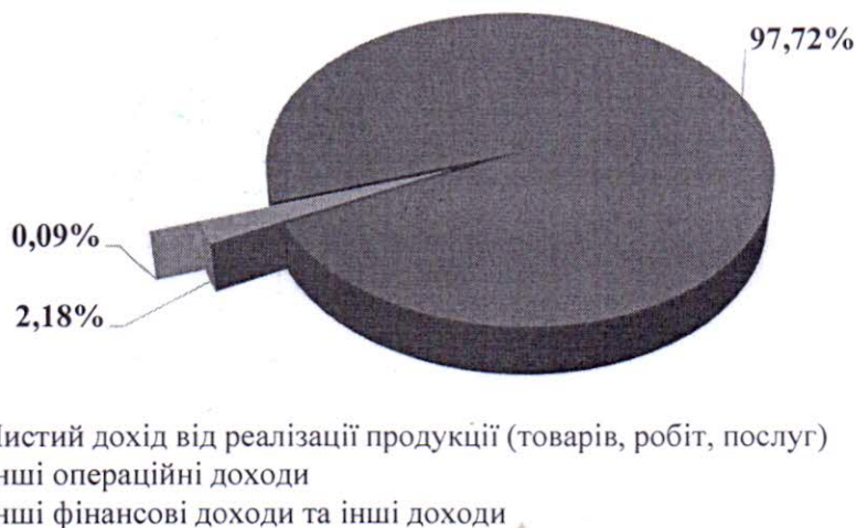
Діаграма 2.1. Загальна структура доходів ТОВ "ГРЕЙД-ПЛЮС" за 2022 р.

Відповідно вищевказаних даних, чистий дохід від реалізації становить більше 97% загального доходу Товариства. Інші операційні доходи складають 2,18%, інші фінансові доходи та інші доходи складаються лише 0,09% всіх доходів ТОВ «ГРЕЙД-ПЛЮС». Згідно до наведених вище даних, у 2022 році